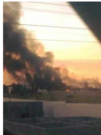
Affrontements du 08/02 0 Tripoli

Sécuritaire / Tripoli : De nouveaux affrontements entre milices rivales ont été rapportés dans l'après-midi du 08/02 dans le sud de Tripoli, dans la zone d'Abusalim, de Salaheddin et de Hadbah entre les groupes armés de Misrata (proche de K.Gwhell) et de Gneiwa (proche du GNA). Alors que la journée du 09/02 est restée plutôt calme, des accrochages sporadiques ont de nouveau repris dans la nuit du 9 au 10/02. La situation s'est progressivement normalisée.